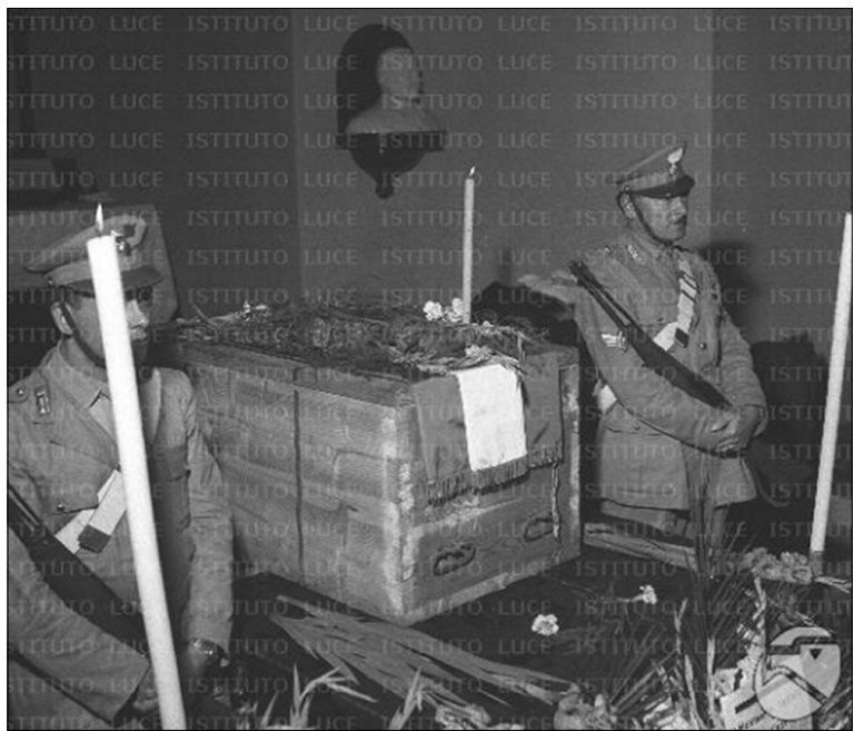
Predappio, 31 Agosto 1957: la salma del Duce vegliata dal picchetto d'onore dei Carabinieri