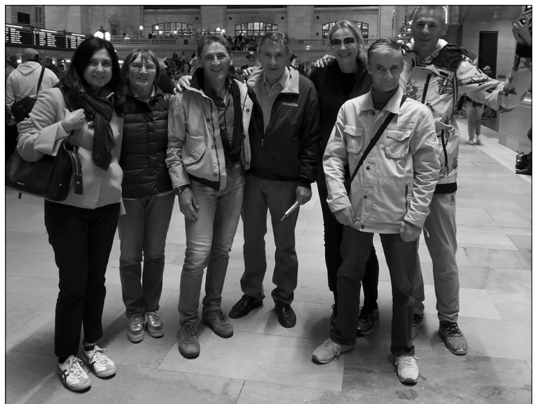
Foto scattata nell'ottobre 2019 al Grand Central Terminal di New York.