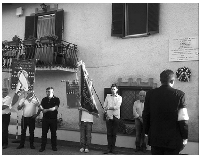
La manifestazione del 4 Giugno 2014 in ricordo della strage partigiana davanti la lapide che, a Santa Maria Pugliano, da quel giorno, ricorda l'atroce delitto.