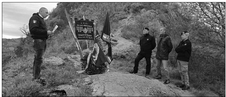
Palazzolo sul Senio, 12-13 Aprile - In ricordo degli Arditi del Battaglione "Forli" che combatterono sulla Vena del Gesso. ANAI Bologna presente!