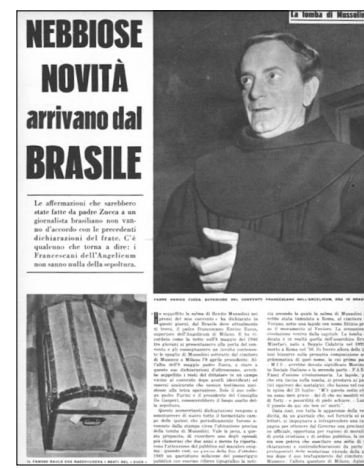
L'articolo di Renzo De Monticelli che riportava le voci sulla presenza della salma di Mussolini a Nettuno.

La restituzione della salma di Mussolini alla famiglia pose fine ad un pezzo di storia italiana. Nell'atto di pietà e di "resa" della Repubblica "nata dalla Resistenza" (leggasi "Piazzale Loreto"), non vi fu nessun accordo sottobanco col MSI, né cedimento al fascismo, solo la constatazione di essere giunti alla fine di una farsa. Infatti, il Governo monocoloro di Adone Zoli - che restituì la salma alla famiglia - avrebbe ricevuto lo stesso i voti di fiducia missini in Parlamento, non era necessaria una "compravendita". Certamente, Almirante perorò la causa, ma fu la DC a