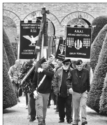
Predappio, 27 Aprile - Cerimonia in onore del Duce