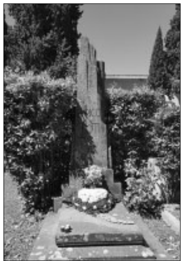
La tomba di Enrico Toti al Verano, amputata del fascio littorio laterale nel primissimo dopoguerra. L'ennesimo sfregio antifascista ed anti-italiano dopo il vile attacco al corteo funebre dei sovversivi romani nel 1922

Cento anni fa la traslazione della salma al Verano e l'ennesimo sfregio antifascista